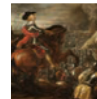
Batalla de Nördlingen 1634

En el gobierno del Conde Duque de Olivares la calidad de los Tercios fue disminuyendo, superados por ejércitos mejor organizados. Al morir Carlos II existían 65 Tercios en Italia, Cataluña y Flandes, con miles de plazas sin cubrir.