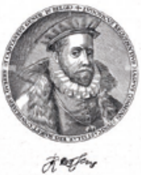
DON LUIS DE REQUESES Y ZÚÑIGA Comendador de Castilla desde 1543