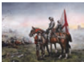
Pinturas de Augusto Ferrer-Dalmau

Durante los reinados de Felipe II y Carlos V se libró un rosario de batallas en las que destacó la eficaz actuación de los Tercios, de Pavía a San Quintín y Gravelinas.